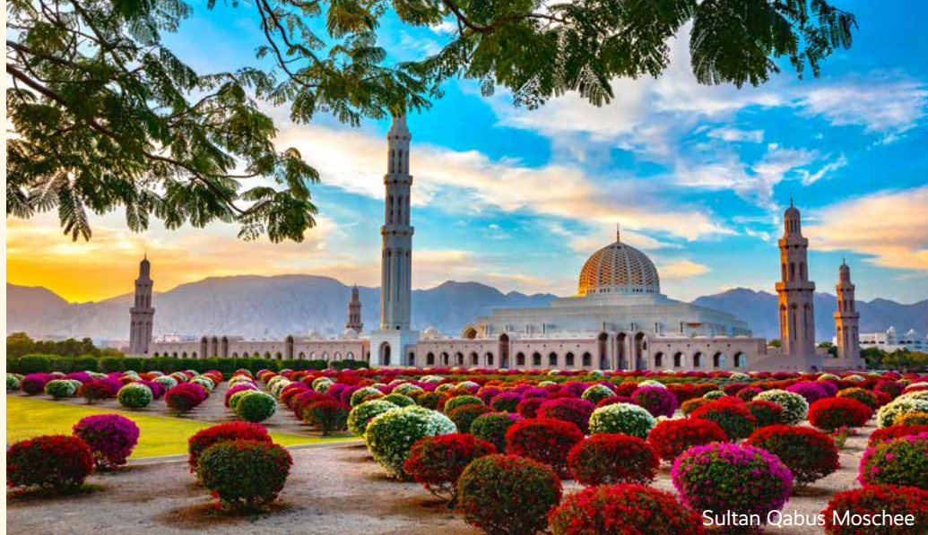
Sultan Qabus Moschee