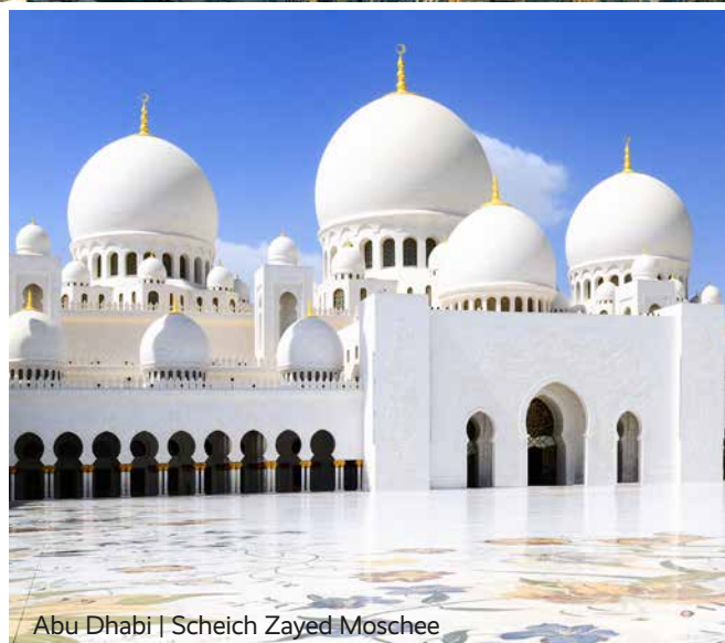
Abu Dhabi | Scheich Zayed Moschee

VERANSTALTER: REISEWELT GMBH, A-4020 LINZ, EUROPAPLATZ 1A, Tel.: +43 732 6596 26001, office@reisewelt.at Nähere Details zur Reisewelt GmbH können mittels GISA Abfrage ( www.gisa.gv.at/abfrage ) in Erfahrung gebracht werden: GISA-Zahl 14955723 Gemäß der Pauschalreiseverordnung (PRV) sind Kundengelder bei Pauschalreisen und verbundenen Reiseleistungen der Reisewelt GmbH unter folgenden Voraussetzungen abgesichert: