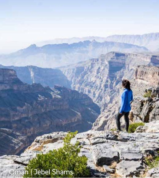
Oman | Jebel Shams