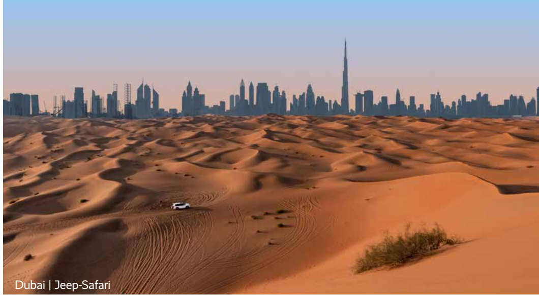
Dubai | Jeep-Safari